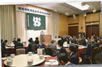
▲ 沢山の同窓生が参加し、昨年の支部総会。