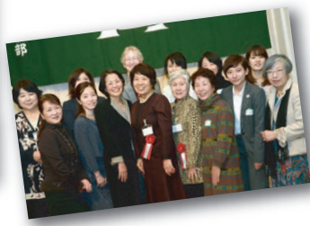
▲ 若い方、女性の出席が増えていきます。